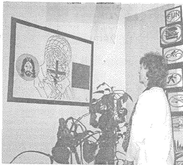
„Lebenszyklen“ des Malers Rudi Fischer aus Stahnsdorf sind gegenwärtig im Teltower Bürgerhaus in der Ritterstraße 10 zu sehen. Konstruktivismus und Expressionismus sind die bevorzugten Ausdrucksformen des Künstlers. In Teltow werden jedoch Werke verschiedener Stilrichtungen gezeigt, die sich mit den einzelnen Abschnitten des menschlichen Lebens befassen. Die Kunstausstellung kann noch bis zum 28. Februar besucht werden.